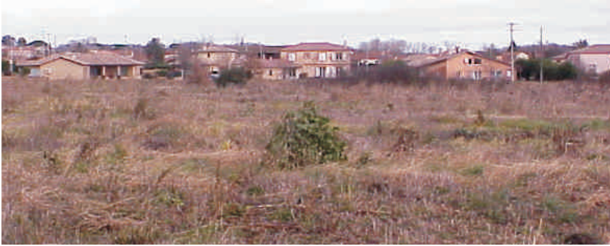
Etat des lieux